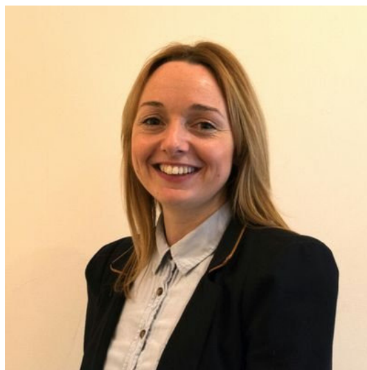
Llinos Medi Arweinydd y Cyngor

Yn olaf, hoffwn ddiolch i'r holl drigolion a phartneriaid sydd wedi cydweithio â'r Cyngor i sicrhau'r gwasanaethau gorau i bobl Ynys Môn yn ystod y flwyddyn ddiwethaf, ac edrychaf ymlaen at eich cefnogaeth eto yn 2019/20.